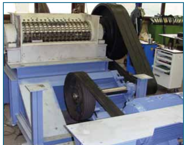
Fig. 4: Entraînement par courroies trapézoïdales et arbre intermédiaire