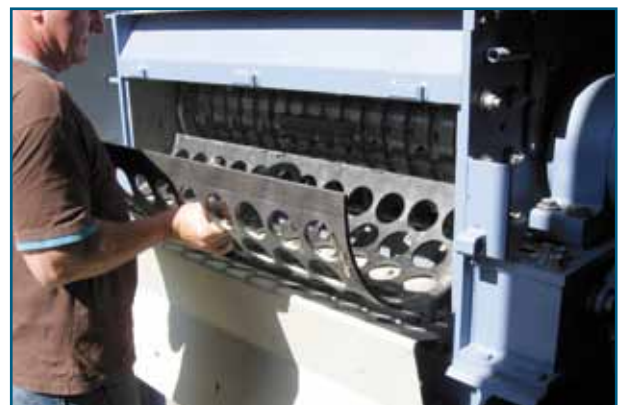
Fig. 5: Support de grille à commande hydraulique, remplacement aisé et rapide de la grille