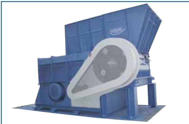
Fig. 1 : EWS 45/120

Conçu pour des débits élevés et des applications difficiles, le déchiqueteur à un arbre Herbold est une évolution de la série standard HR.