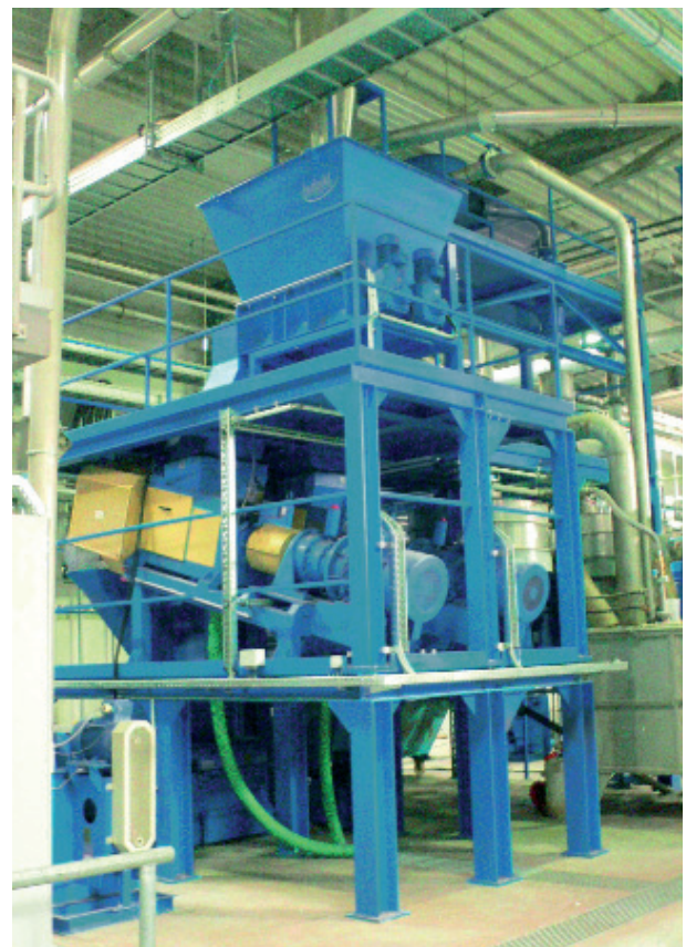
Deux vis EPS 75 munies d'un réservoir de distribution

vie par un sécheur thermique simple dont la puissance de chauffage sera nettement réduite. Pour certaines matières, il sera nécessaire de désagréger ensuite le produit égoutté. La vis d'égouttage peut également venir compléter des installations existantes.